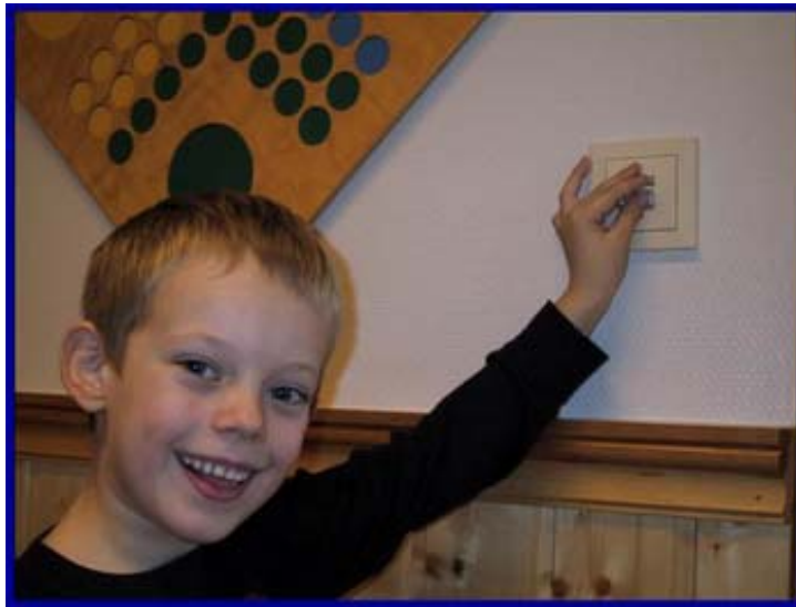
Bryter til gulvvarme